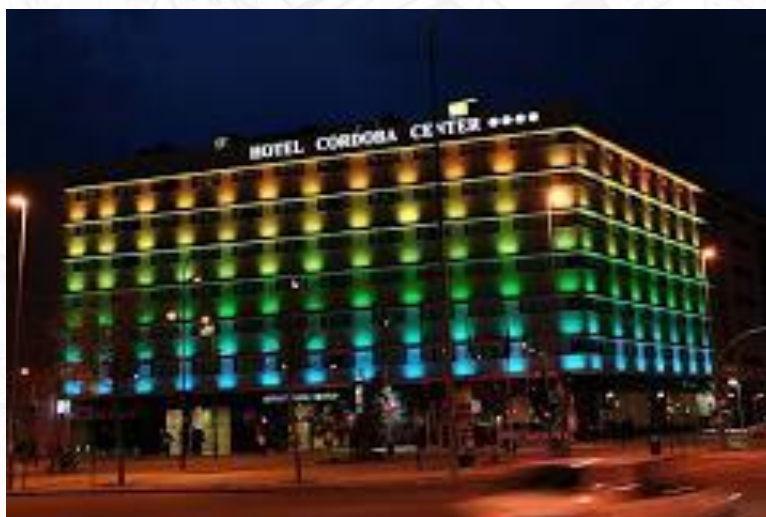
Hotel Córdoba Center